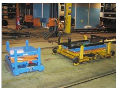
Den gamle model (tv.) og den nye model (th.)

Nyeste projekt var udskiftning af eksisterende løfteborde monteret på en undervogn med skinnehjul. Disse gamle modeller var blevet for store og klodsede og DSB bad derfor TRANSLYFT om at lave en ny udgave. Det resulterede i typen TRD 2000 med integreret undervogn med skinnehjul. Løftebordene bruges når der skal afmonteres eller udskiftes dele under togene. Togene hæves med store donkrafte og løftebordene som er placeret på skinnerne under togene, fungerer som en hjælp til medarbejderne, til at løfte de tunge togdele.