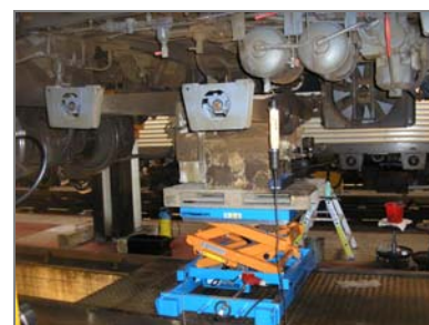
Udskiftning af gearkasse